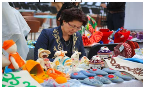
ұлттық қолөнер көрмесі