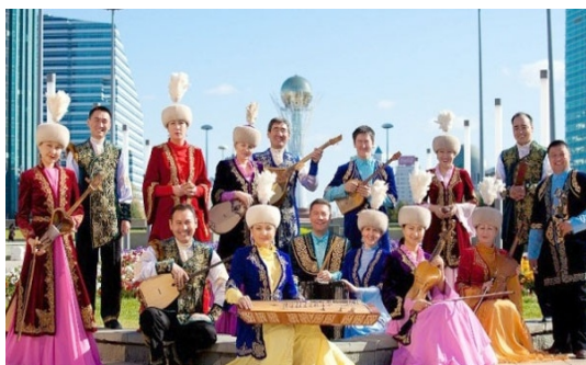
ұлт аспаптар оркестрі

3. Суреттердің, тірек сөздердің көмегімен Астанадағы Қала күні мерекесінің тойлануы туралы досыңызға әңгімелеңіз.