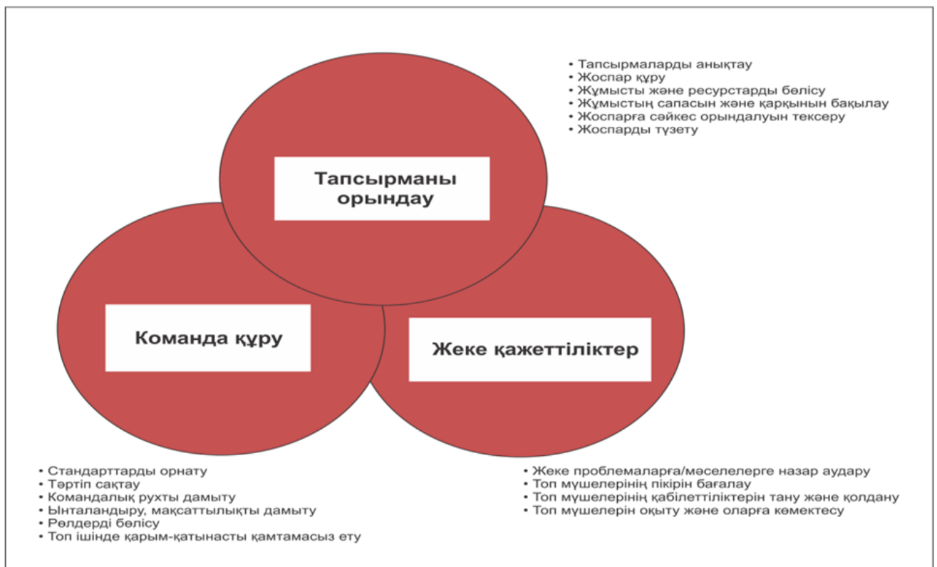
2-сурет. Топтағы бірлескен жұмыс жүргізу себептері